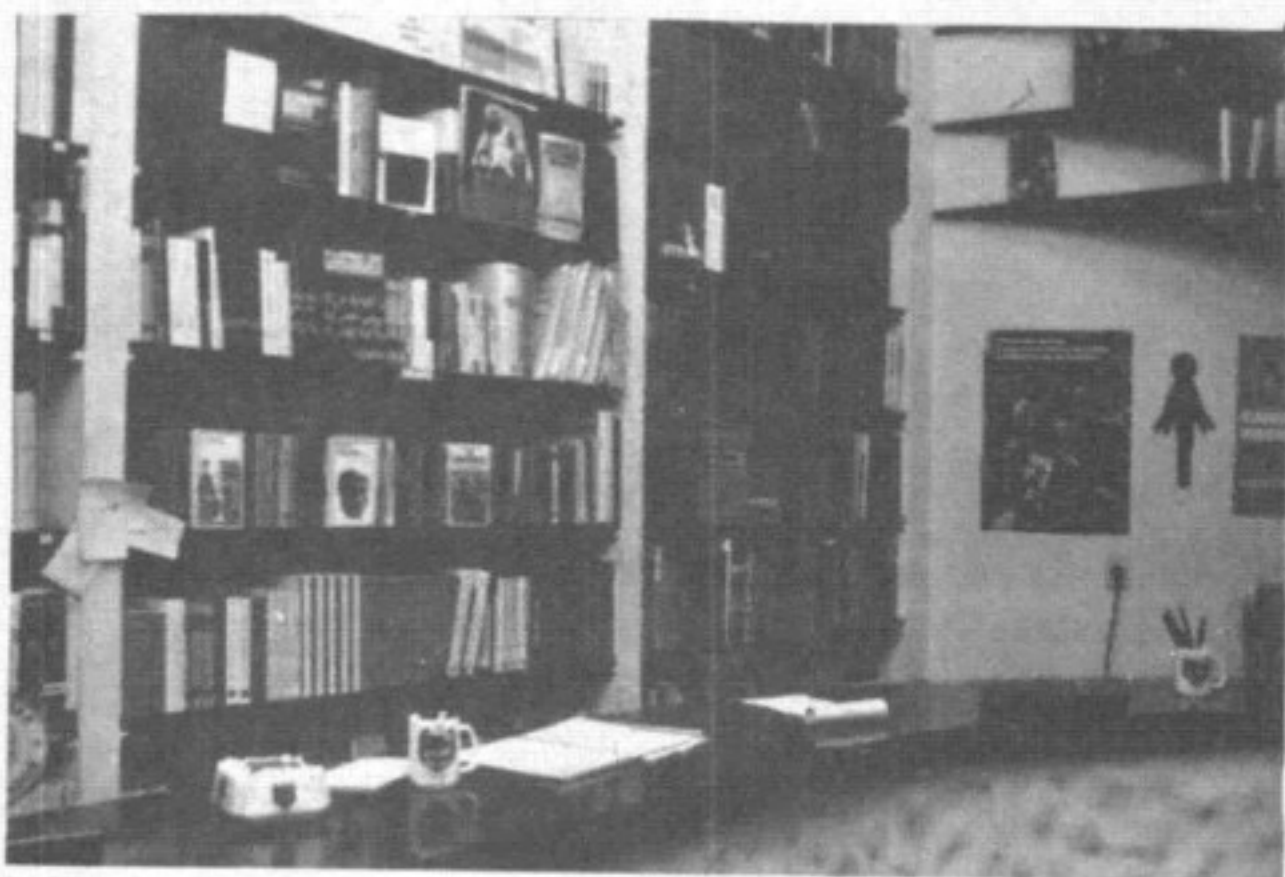
Librería: servicio a la comunidad universitaria.

El Departamento de Publicaciones fue creado dentro de la estructura del Vice-Rectorado Económico. En 1979, por Resolución Rectoral N° 164/79, paso a depender directamente del Rectorado. En 1980, por Resolución Rectoral N° 7/80, cambió su denominación por la de Departamento Editorial.