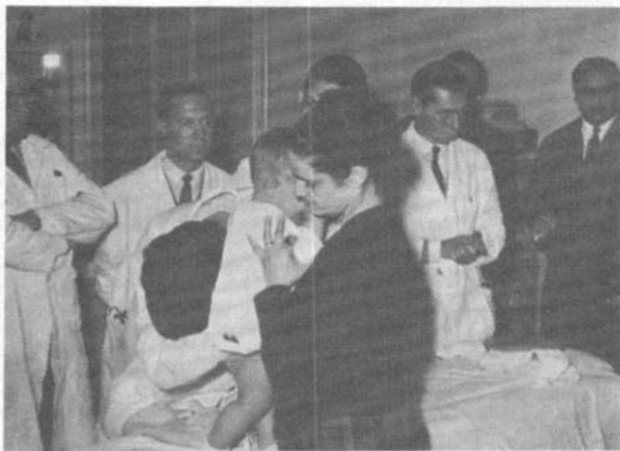
Los primeros exámenes de habilitación.

El año 1963 marca el comienzo de una tercera etapa cuyo objetivo fundamental es sentar las bases de la estructura alcanzado hasta el momento, elevar a la Facultad al nivel actual de exigencias. Esto implica la creación de una moderna Escuela de Medicina con sus laboratorios de investigación, cátedras especializadas a cargo de docentes calificados humana y científicamente, coordinación entre cátedras y departamentos, trabajo metódico, participación activa del alumno en su forma-