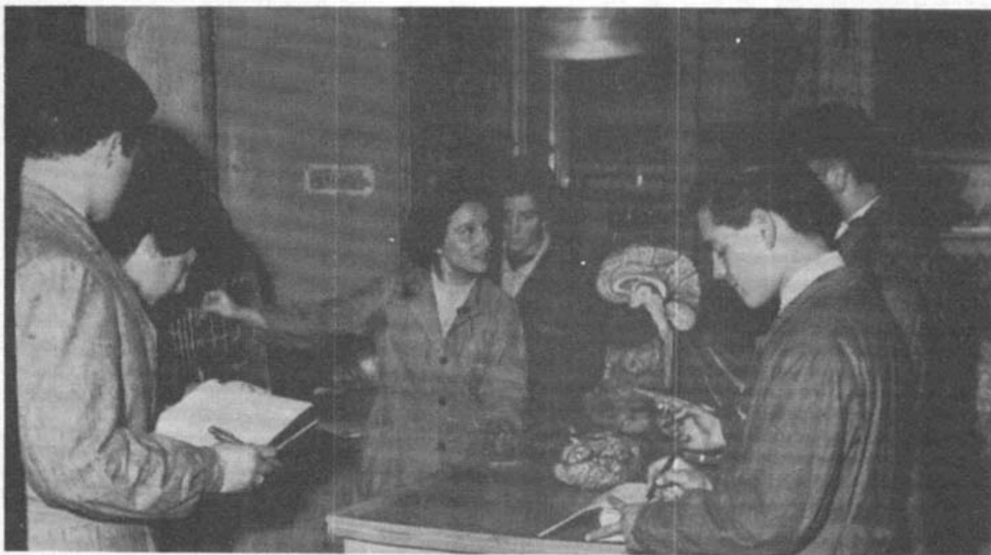
1959: Clase práctica de Medicina.

produciendo en la medicina día por día, para mantener informado y formado al cuerpo médico.