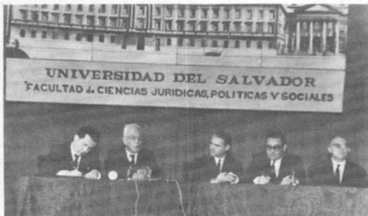
Arnold Toynbee dicta una conferencia en la Universidad.