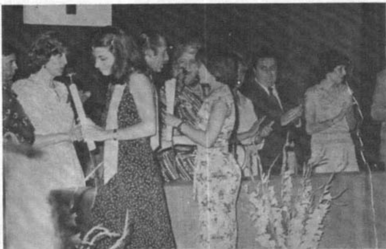
1980: Acto de colación de grados.