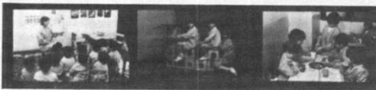
Poniendo en práctica lo aprendido...

Al mismo tiempo que se transitaba el arduo camino de insertar esta nueva disciplina en el campo de la educación y de la salud mental, el Instituto de Psicopedagogía de la Universidad del Salvador jalonaba su trayectoria con importantes eventos académicos, científicos, profesionales y culturales.