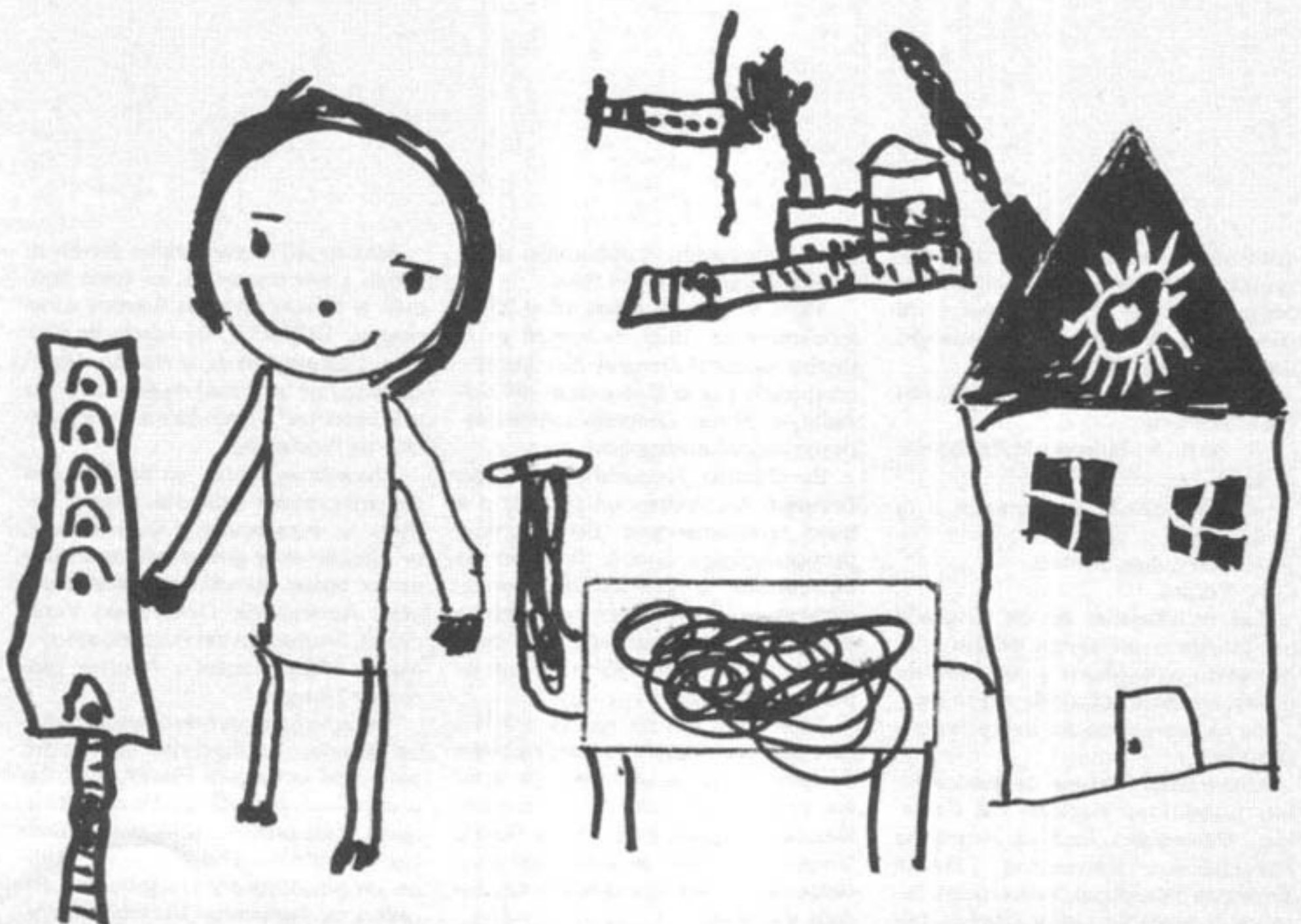
Preescolar: integración del recorte.

— Se realiza el Primer Simposio Nacional sobre la Carrera de Psicopedagogía, los días 12 y 13 de mayo. El nivel alcanzado por la psicopedagogía en nuestro país y el rol de psicopedagogo en la sociedad actual, hacía necesario un Encuentro Nacional de quienes están directamente comprometidos en la formación universitaria de estos profesionales, con el fin de reflexionar sobre el perfil profesional del mismo y elaborar un curriculum mínimo que asegure una formación adecuada. A tal efecto se reunieron en la sede de la Facultad de Psicopedagogía delegados de siete universidades del país, y de una Asociación de profesionales de la Psicopedagogía. El objetivo