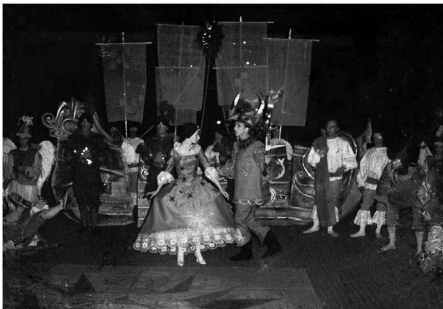
Espectáculo al aire libre. Teatro de Ensayo. (1967)

Existe entonces una especie de suspenso que pertenece solo al teatro. El actor está ahí, la gente está ahí, se forma entre ellos una pila magnética. Es un acto de amor colectivo que acontece en el presente. Ningún arte logra esa impresión que da el teatro en el plano de la vida que se renueva a cada instante y de la muerte que planea alrededor de nosotros. El arte de lo efímero, la poesía de lo efímero, la poesía de la condición humana alcanzan su máxima expresión por obra de la presencia. Estamos ahí y nos entregamos unos a otros.” 4