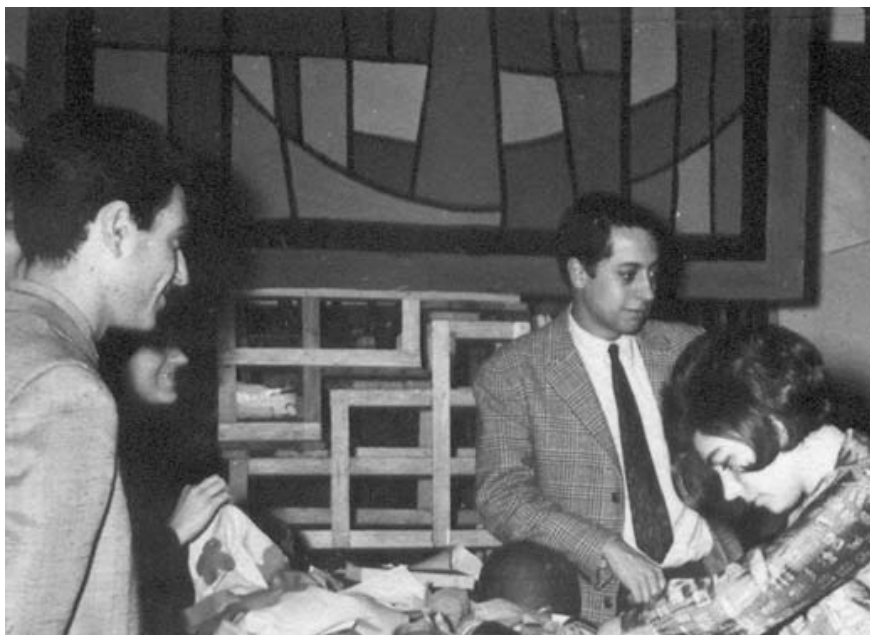
Taller de realización del Teatro de Ensayo- Sede Callao 542. (1962)

mal. Sería pueril creer que una realización escénica, por bella e ingeniosa que sea, puede cambiar en algo la naturaleza íntima del teatro actual”. 3