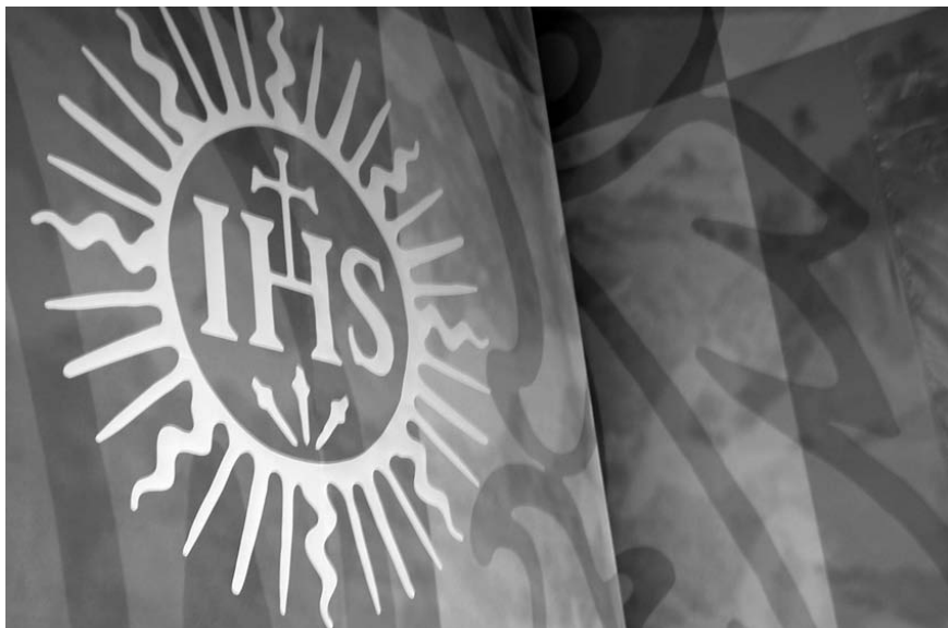
Detalle de la escenografía para la Celebración del 50 aniversario de la Universidad del Salvador.

cación del cuento, 1959. Sin embargo, la actualidad del texto mantenía vigencia a través de las profundas reflexiones de Pozo , que revelaban el egocentrismo de los dirigentes políticos en oposición al sentido común expresado por Mariner , un hombre sensato.