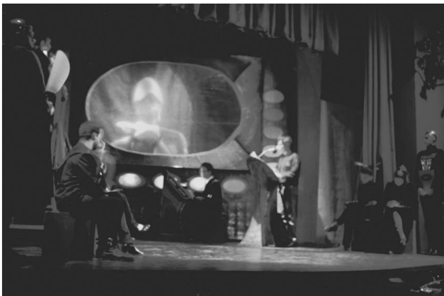
Teatro universitario, obra: Ohé Pozo satélite Yapet. (1995)

ricanas entrelazadas en una estructura musical. La estructura del guión quedó definida por un único acto dividido en nueve acontecimientos. La sonoridad compuesta por el discurso poético verbal, los efectos de sonido ambientales y la banda musical que combinaba melodías antiguas con sonidos discordantes, generados digitalmente, acompañaba la sencillez contenida en el texto. La palabra se fusionaba como una sugerente melodía junto a la música digital, y los efectos realizados por voces humanas evocaban imágenes y sensaciones interiores a las que el marco visual debía contener o acompañar.