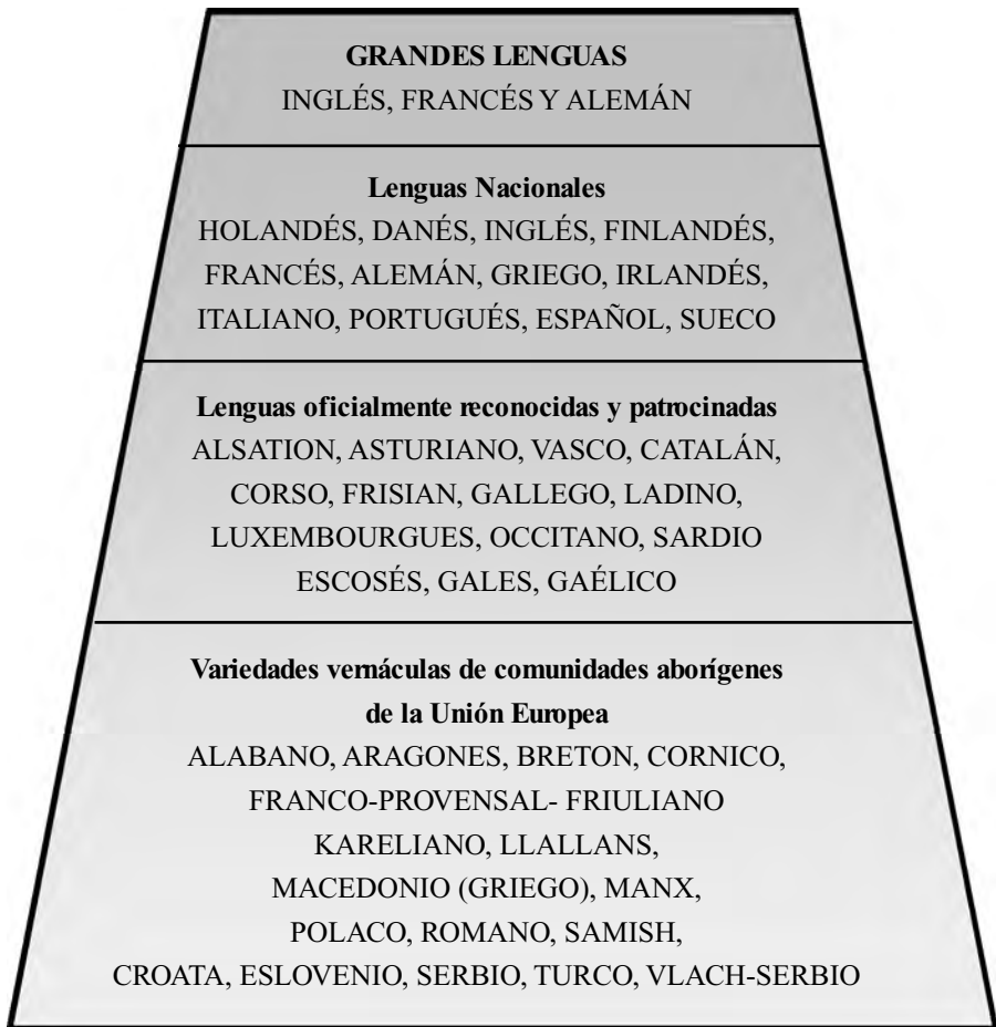
Figura I. Jerarquía de las lenguas para la Unión Europea

Un caso particular que me gustaría mencionar a modo de ejemplificación es el de uno de mis alumnos. Me vino a la mente la situación presentada por este estudiante quien es abogado y además cuenta con un postgrado en Derecho Ambiental Internacional egresado de la Universidad del Salvador, una de las casas de altos estudios más importantes del país, y quien se desempeña como abogado en el sec-