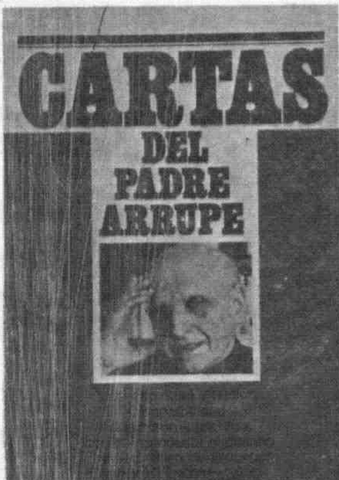
CARTAS DEL PADRE ARRUPPE

Ediciones Paulinas, Buenos Aires, 1980, 73 págs. Esta obra es presentada por el Centro de Espiritualidad de la Provincia Argentina.