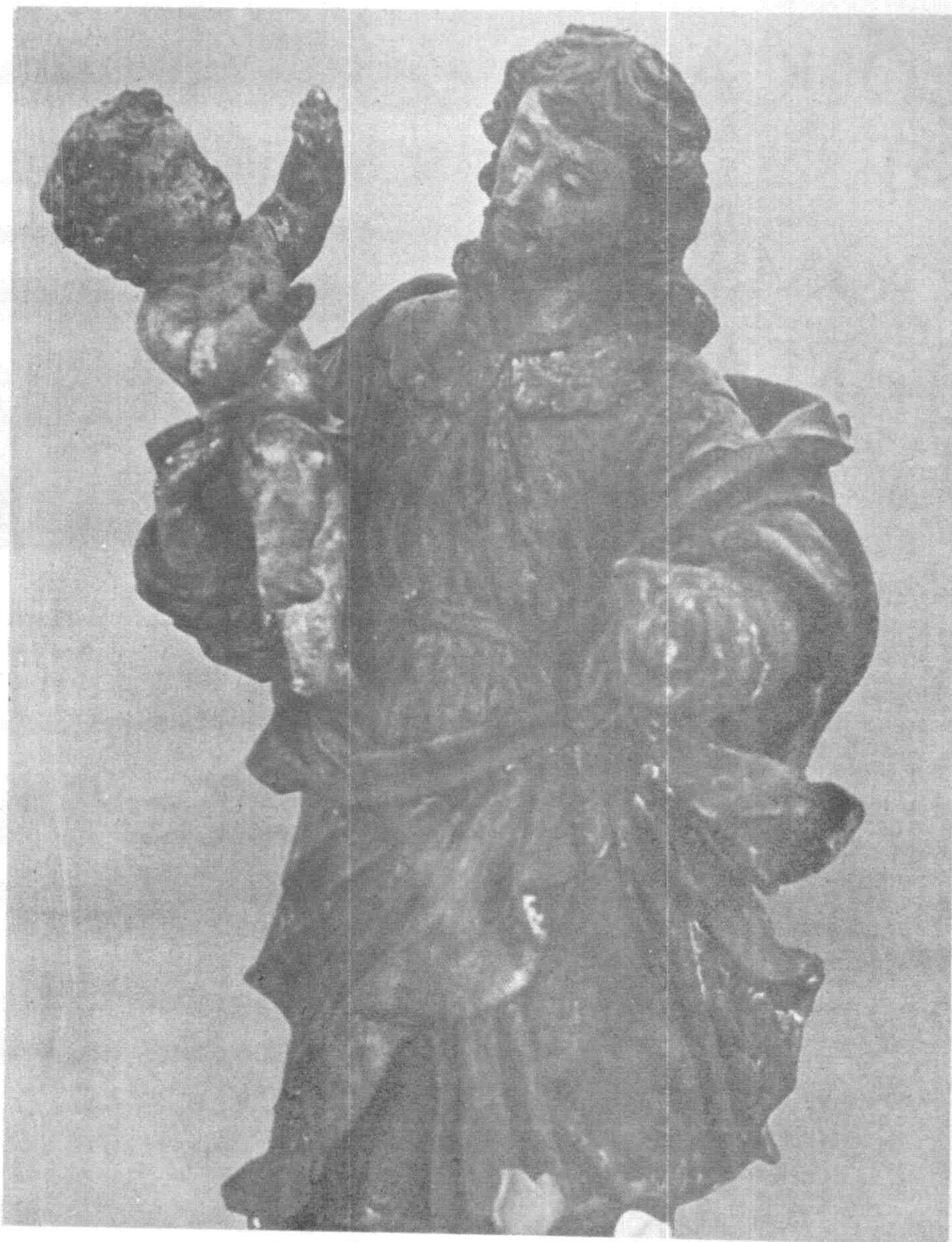
San José. Talla misionera. Se venera en Boquerón, Santiago del Estero.