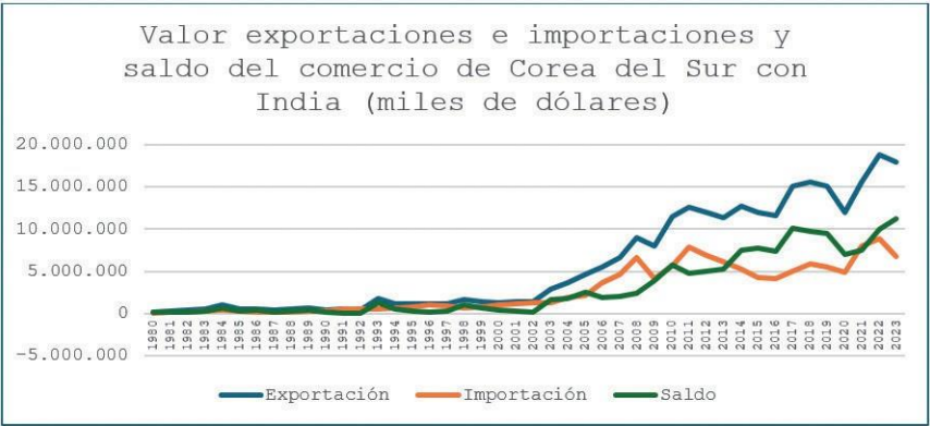
Valor exportaciones, importaciones y saldo del comercio de Corea del Sur con India, 1980-2023 (miles de dólares)

Nota. Elaboración propia con base en datos de KITA (2024a).