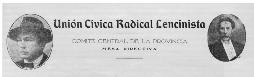
Figura 2. Membrete que encabezaba el petitorio de la UCRL al Congreso (1930)