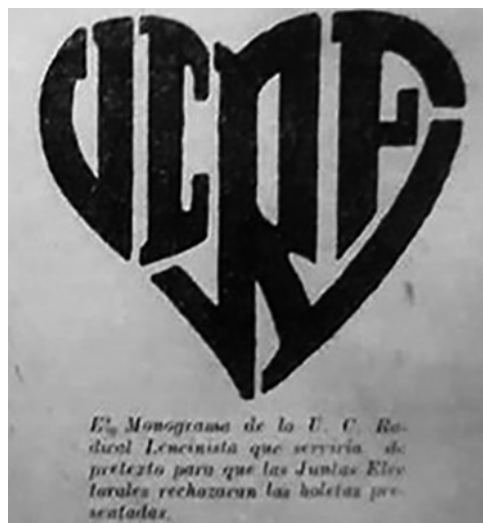
Figura 4. Monograma que encabezaba la boleta de la UCRF en 1934