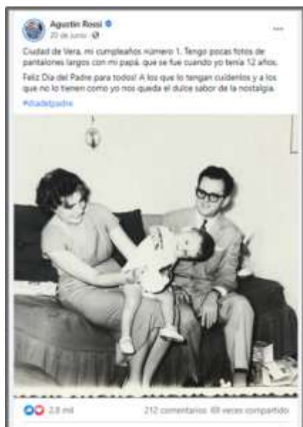
Imagen 1: Posteo en Facebook del dirigente político santafesino Agustín Rossi sobre su infancia.

Annunziata (2021) define como fórmulas de identificación a la mayoría de los intentos que hacen los políticos por mostrar cercanía. Según esta autora, los políticos apelan a recetas comunicacionales que proponen el “yo soy usted”, “votame-votate”, “soy un tipo (o tipa) común”. En esta clave, la apelación a las historias de vida (tanto de los políticos, como de la gente “normal”) y, en general, toda intimización de situaciones protocolares y politización de situaciones privadas o íntimas tienen como objetivo franquear la distancia y lograr una mayor proximidad.