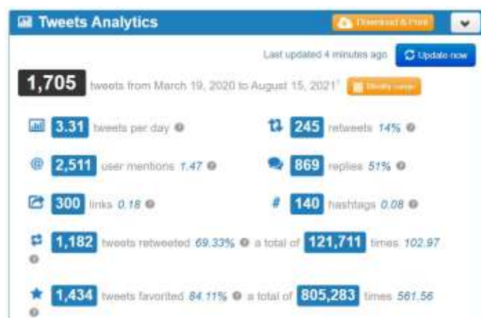
Gráfico 5: Datos que dan cuenta del nivel de interacción que mantiene el Ministro uruguayo Salinas en sus conversaciones en Twitter.