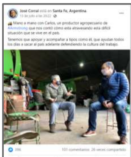
Imagen 2: Posteo en Facebook del dirigente político santafesino José Corral sobre encuentro con un productor agropecuario.

Annunziata distingue entre las “presencias de escucha” y las “presencias de empatía”. Las primeras son aquellas en las que “los políticos se desplazan para prestar atención a las preocupaciones y anhelos de la gente de un territorio determinado, de manera que tienden a hablar poco y a dejarles más bien la palabra a los ciudadanos”, y que son “muy frecuentes en las campañas electorales y sirven para armar las estrategias de sucesiones de spots con historias de vida” (Annunziata, 2021, p. 125).