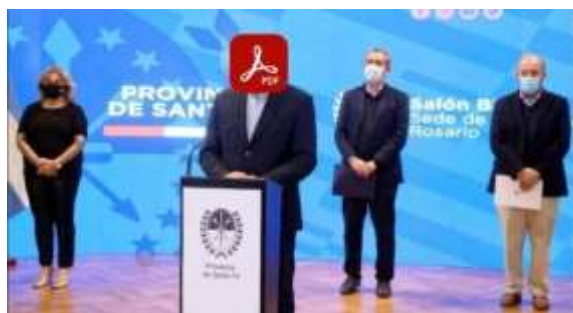
Imagen 3: Se convirtió en meme. La gestión Perotti eligió distribuir documentos PDF con las decisiones respecto a las restricciones a la circulación y a las actividades que periódicamente iban actualizándose.

En los primeros meses de la pandemia, los gobernantes ensayaron formas escolarizadas de presentación de filminas (gobierno nacional, presentación a cargo del presidente Alberto Fernández) o información publicada en formato PDF (especialmente utilizado por el gobierno de la provincia de Santa Fe).