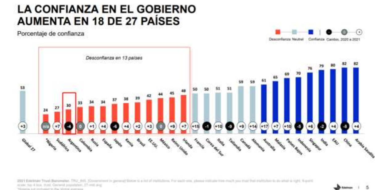
Gráfico 2: Niveles de confianza en los gobiernos.