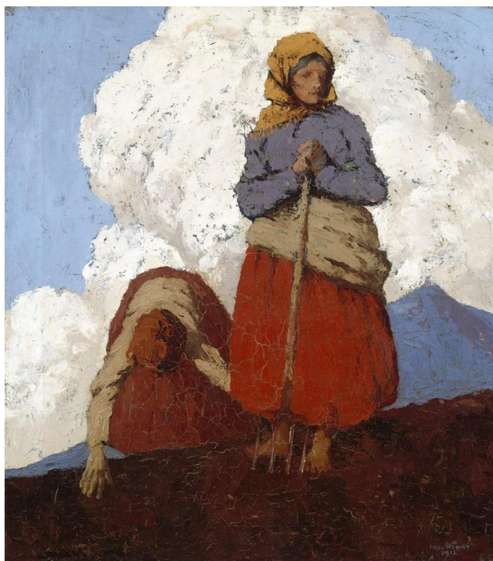
Fig. 3. Henry, Paul. (1912). The Potato Diggers [Oil on canvas]. Obtenido de http://onlinecollection.nationalgallery.ie/objects/4046/the-potato-diggers

En el nivel denotativo vemos: un paisaje rural y dos mujeres descalzas trabajando la tierra.