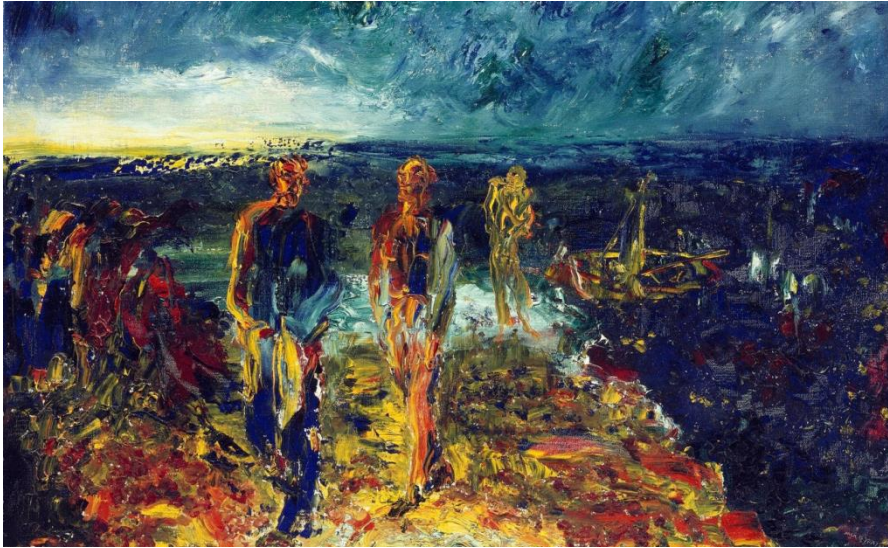
Fig. 2. Yeats, Jack. B. (1946). Men of Destiny [Oil on canvas]. Obtenido de http://onlinecollection.nationalgallery.ie/objects/1559/men-of-destiny