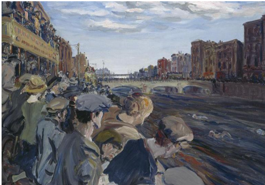
Fig. 1. Yeats, Jack. B. (1923). The Liffey Swim [Oil on canvas].

*Aclaración: Esta pintura ganó la medalla de plata por pintura en el "Concourse d'Art" en los Juegos Olímpicos de París de 1924.