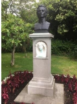
MONUMENTO A JAMES CLARENCE MANGAN DUBLIN, IRLANDA