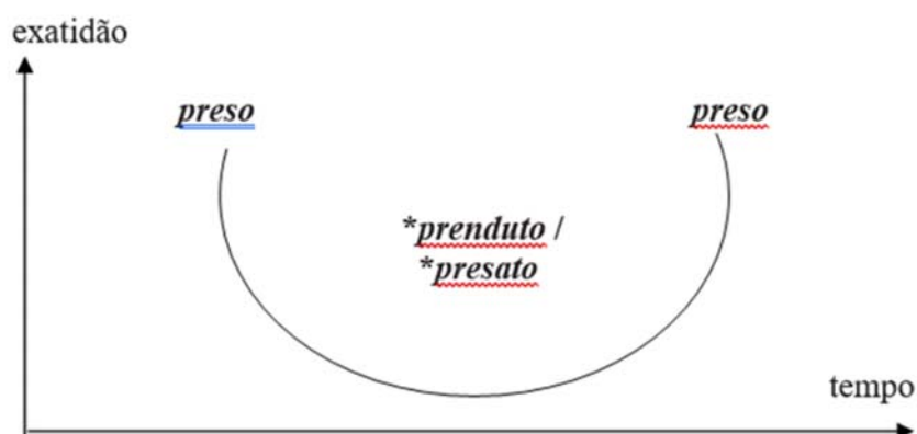
Figura 1. Percurso em U