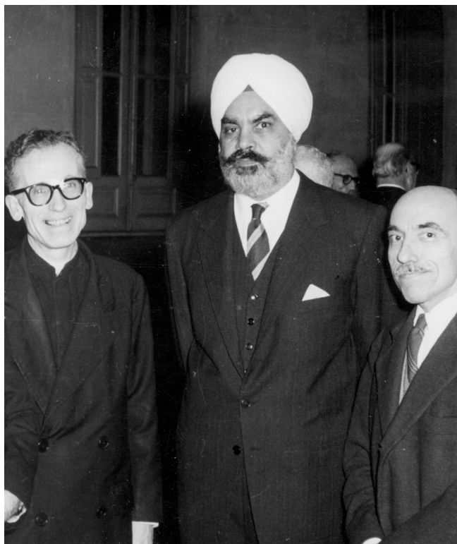
Inauguración del Centro de Estudios Orientales. [1964]