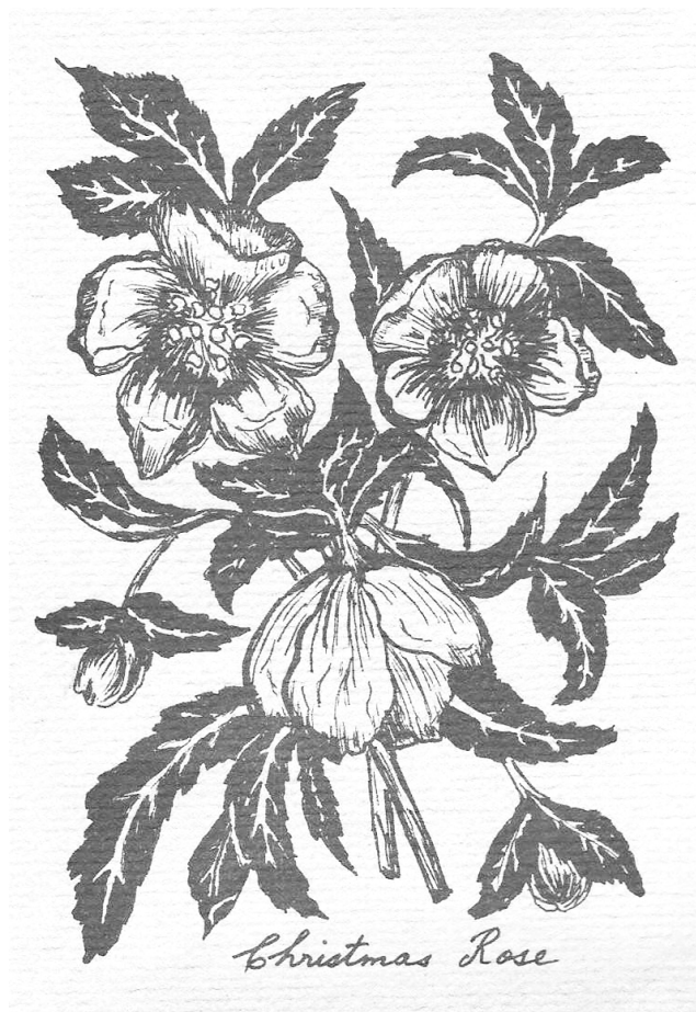
Serie Correspondencia. Postales (1979)

El respeto al orden original es un fundamento teórico que postula que la estructura original de un archivo debe preservar la disposición en que los documentos fueron colocados mientras el acto administrativo estuviera en funcionamiento, y es sobre la base de este supuesto criterio junto con el principio de procedencia 9 que se consigue lograr que la archivística se pueda autodefinir como ciencia en el siglo XIX. Lo que implica que cada archivo debe ser considerado según su