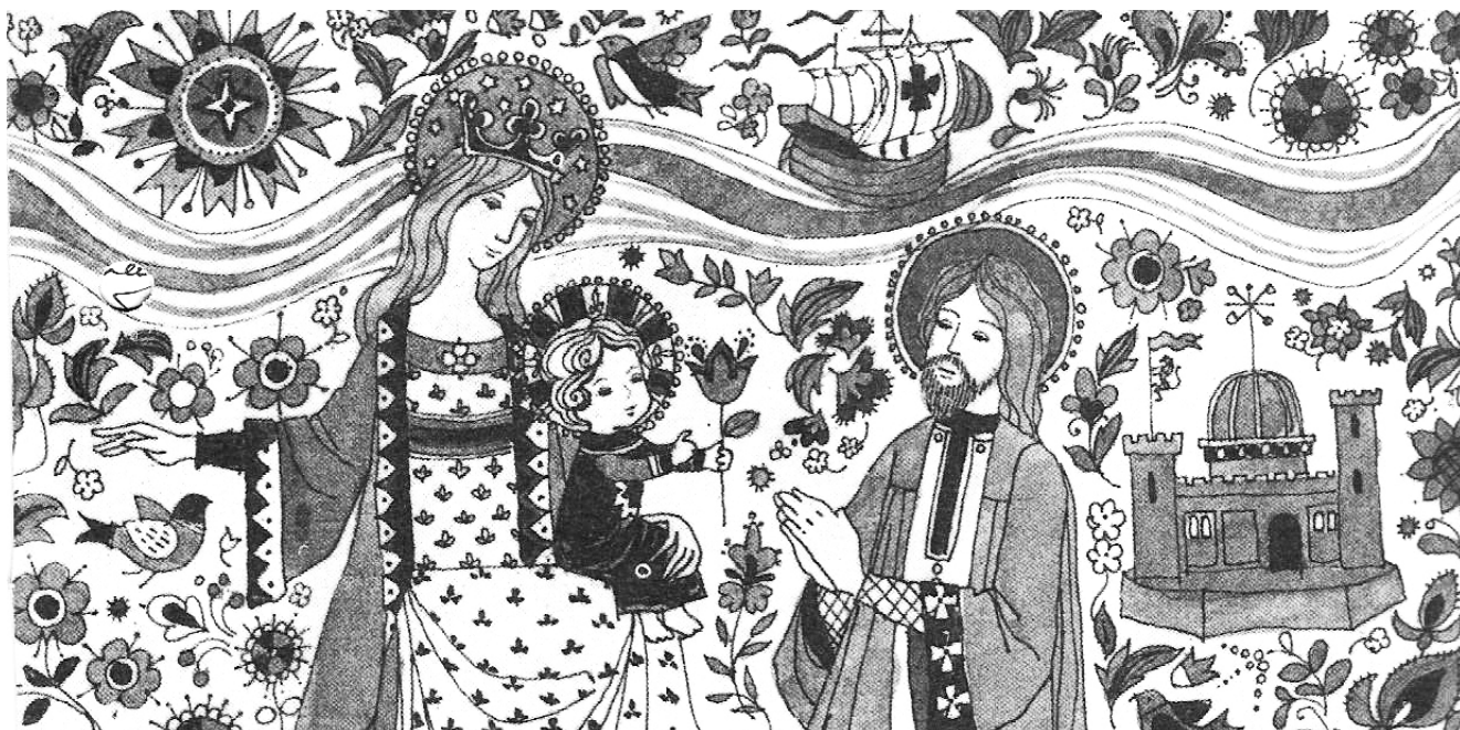
Serie Correspondencia. Postales (1979)

de sus viajes, entre otras manifestaciones escritas. Sin dubitación, el fondo Quiles se gestionó bajo estrictos criterios organizativos. Y cuando hablamos de “ordenación” en archivística, nos referimos a la operación que suele establecerse previamente para determinar la forma en que se dispondrán los documentos dentro de un fondo específico. Los métodos de ordenación pueden ser cronológico, alfabético, numérico y alfanumérico. Para el caso del Fondo Quiles, nos encontramos con una “ordenación” cronológica (año, mes y día), que suele ser la más difundida para disponer documentos y coincide con el orden lógico de la tramitación administrativa. Comenzando por el año más antiguo, los documentos se ordenan hasta la fecha más reciente, dentro de cada año por meses y dentro de estos por días. Sin embargo, en el caso del fondo Quiles el orden cronológico es inverso. Toda la correspondencia acopiada en sus treinta años de gestión está ordenada en forma descendente por año, mes y día.