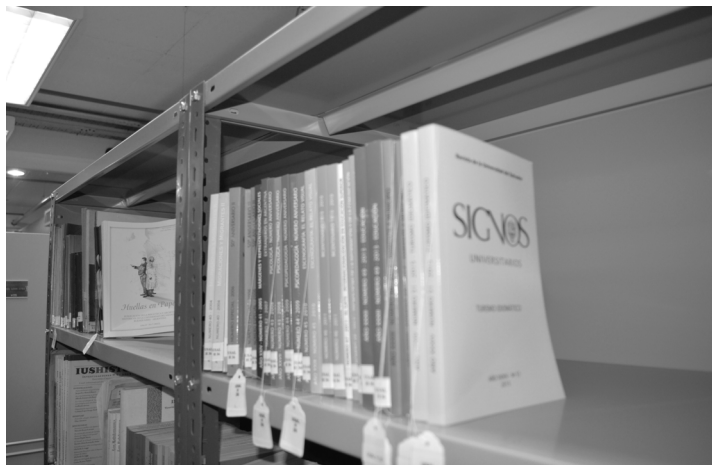
Hemeroteca Histórica Signos

De esta forma, la Biblioteca Central “Padre Guillermo Furlong” realiza un diagnóstico de la comunidad universitaria y, conociendo la riqueza del fondo bibliográfico en humanidades y ciencias sociales, quedan planteadas la Visión y la Misión de la actual Red de Bibliotecas de la Universidad del Salvador con el fin de ejercer sus funciones de: a) gestionar las bibliotecas que integran la RedBUS, b) preservar, registrar y difundir el capital intelectual de la institución, los documentos que ha aceptado para su colección y que constituyen su patrimonio bibliográfico de posesión (físicos) o de acceso (remotos), c) brindar los servicios bibliotecarios definidos para las bibliotecas universitarias, y d) como miembro del Consejo Editorial, intervenir en el proceso editorial de las publicaciones periódicas en línea científicas producidas en la Universidad.