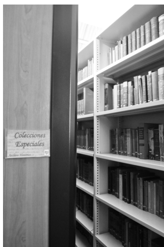
Colecciones Especiales y Archivo

Si bien la RedBUS continúa profundizando en la implementación de las nuevas tecnologías y en el modelo de la biblioteca híbrida, de ninguna manera se interrumpen las funciones bibliotecarias tradicionales. De este modo el nuevo ciclo de planificación estratégica (2014-2017) se orienta a una gestión en consonancia con la tradición de la institución en la que nuestras bibliotecas se encuentran insertas. Dicha tradición se refleja en las Colecciones Especiales y en los documentos de archivo que constituyen el patrimonio documental de valor histórico de la USAL.