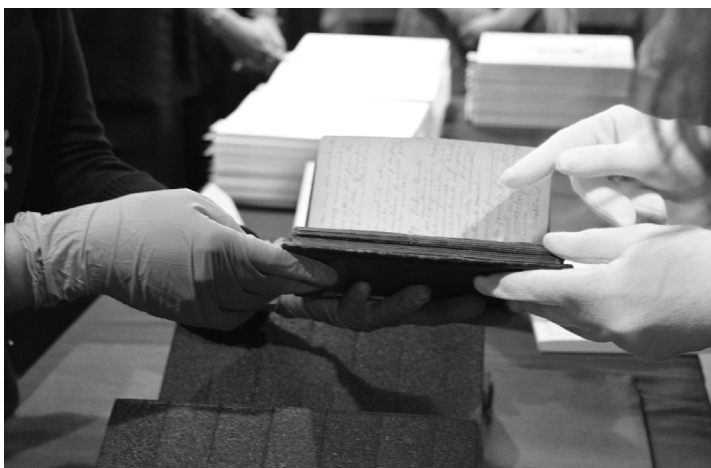
Muestra de libros antiguos