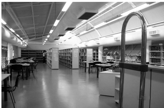
Biblioteca Luis Lagomarsino (Delegación Pilar)

La expansión y crecimiento de los últimos años se hace visible no solo a través de las nuevas áreas de trabajo creadas, Área de Adquisiciones (2012), Biblioteca Tesoro (2012), Área de Sistemas de Información (2014) y Área de Servicios de Archivo (2015); sino también en el abanico de servicios de las tres bibliotecas universitarias que conforman la RedBUS: Biblioteca “R.P. Guillermo Furlong, S. J.” en la ciudad de Buenos Aires , la Biblioteca “Luis Lagomarsino” en Pilar (creada en el año 2004) y la Biblioteca “José Francisco Ezama” en Virasoro (creada en el año 2012).