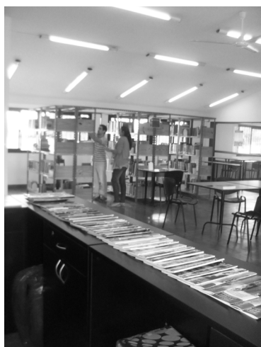
Biblioteca José Francisco Ezama (Delegación Virasoro)