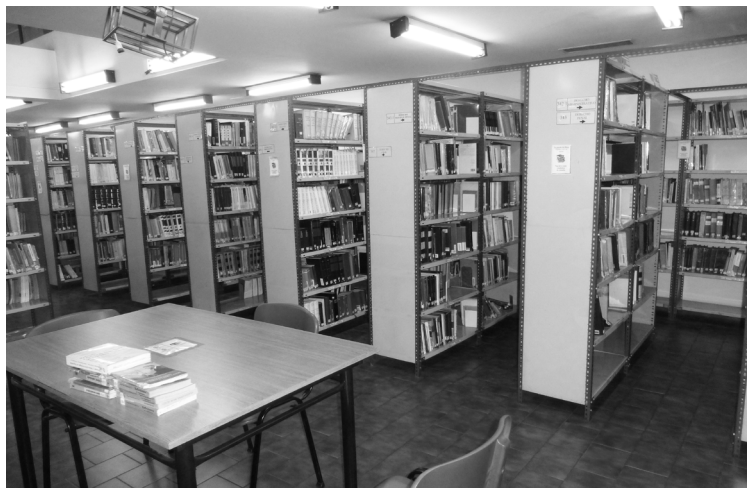
Biblioteca Central R.P. Guillermo Furlong, S.J. en la actualidad.

de la USAL, las que se conciben como un “sistema de bibliotecas”. Los criterios fundamentales que guiaron el profundo cambio que implicó este período fueron los de modernización y la aplicación del concepto de servicio orientado al usuario.