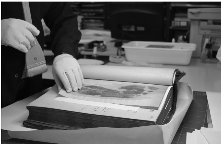
Plan de conservación de documentos

Las Bibliotecas de la RedBUS serán un recurso esencial para lograr la calidad educativa en el proceso de transferencia y generación de conocimiento en la Universidad del Salvador.