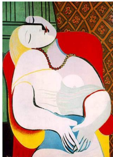
Fig. 2. Le rêve (1932). Coleção particular

Tanto o filme quanto o quadro de Picasso representam o mundo onírico e as posições em que as personagens se encontram na cena fílmica são semelhantes às de Le rêve (1932): olhos fechados, rostos deitados, e a linha que divide os rostos de Betty e Rita aparenta-se ao que vemos na pintura cubista.