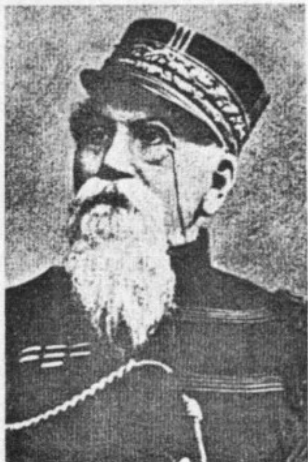
El Gral. L. V. Mansilla.

El prestigio ganado en estas campañas permite vislumbrar un futuro político para el ya reconocido militar. Para ello cuenta con el apoyo del gobierno (Avellaneda) y de algunas provincias cuyos gobernadores, instigados por el propio Roca a través de su cuñado Miguel Juárez Celman, ministro de gobierno de Córdoba, forman una Liga. Este organismo político creado por Roca está sometido a él, pero también es su apoyo. De esta relación