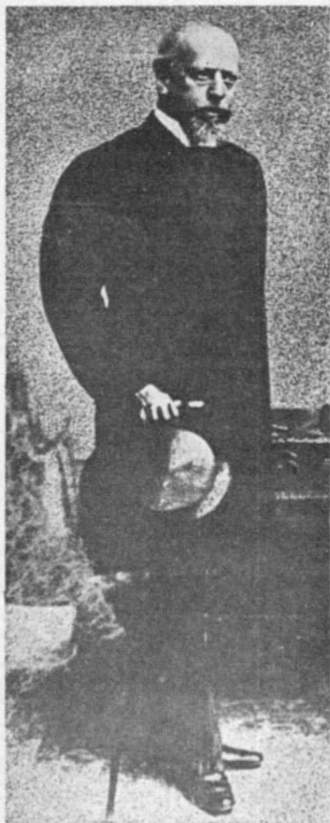
El Presidente Roca

también son los factores ideológicos los que deforman la realidad.