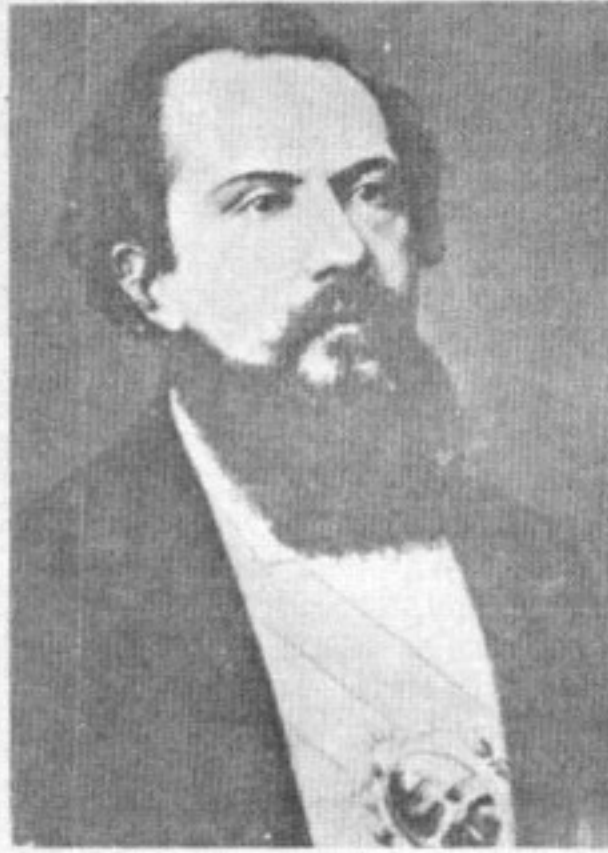
El Presidente Avellaneda.

porque nos falta nuestra Capital—Gobierno, nuestra Ciudad—Nación " 1