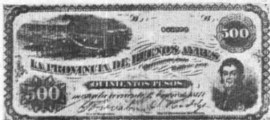
Billetes emitidos en distintas provincias argentinas.