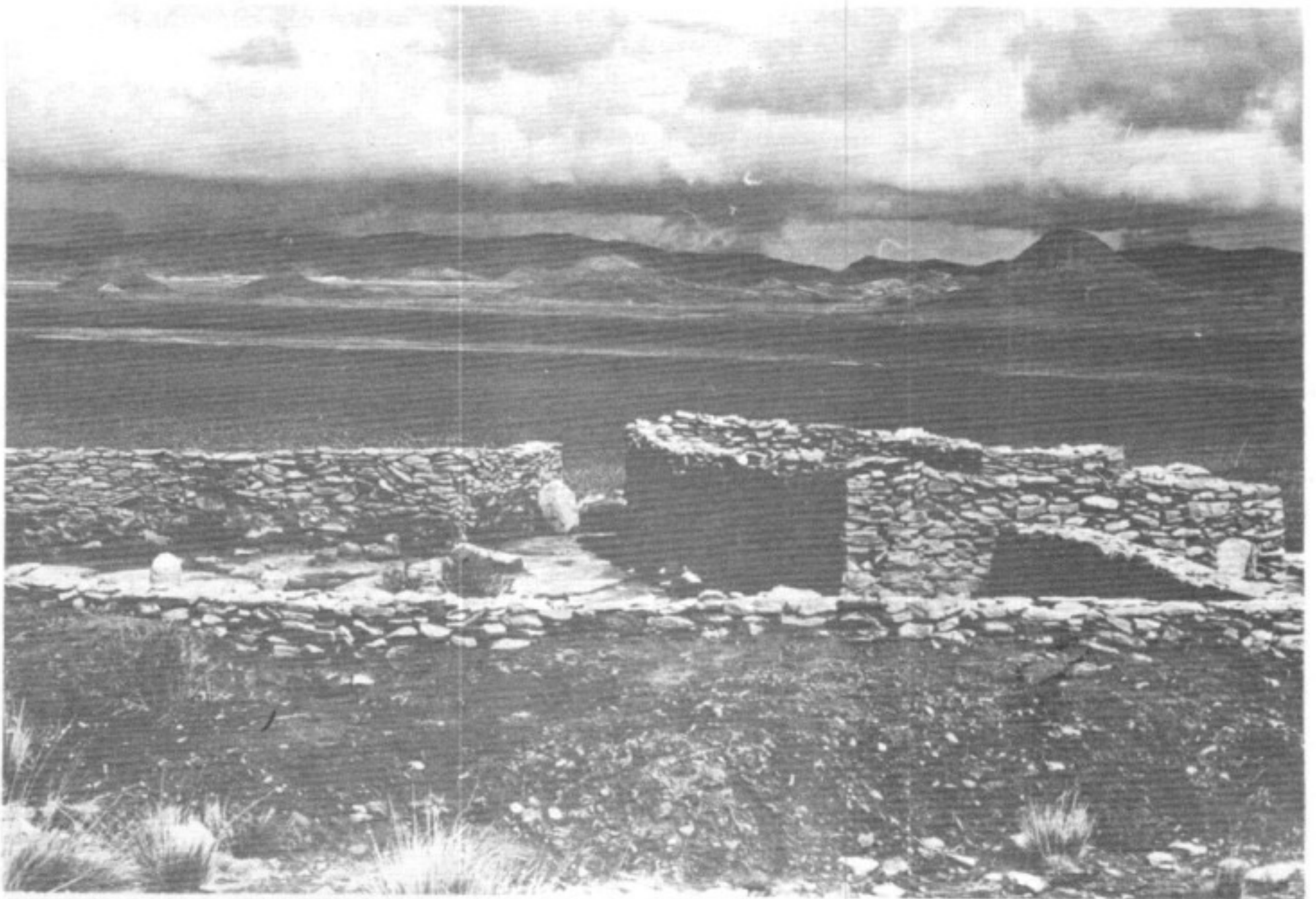
Vista parcial de la reconstrucción del Pucará de Rinconada, Prov. de Jujuy.

Permanece incólume el interés por nuestro Noroeste, macroárea geográfica que podemos definir como un cuadrante limitado al Oeste, por las altas cumbres de la Cordillera de los Andes y al Este, por el Meridiano 63° y que se extiende hacia el sur hasta el Paralelo 32°, pudiéndola caracterizar suscintamente como un espacio que marca la diferencia entre las tierras altas y las tierras bajas.