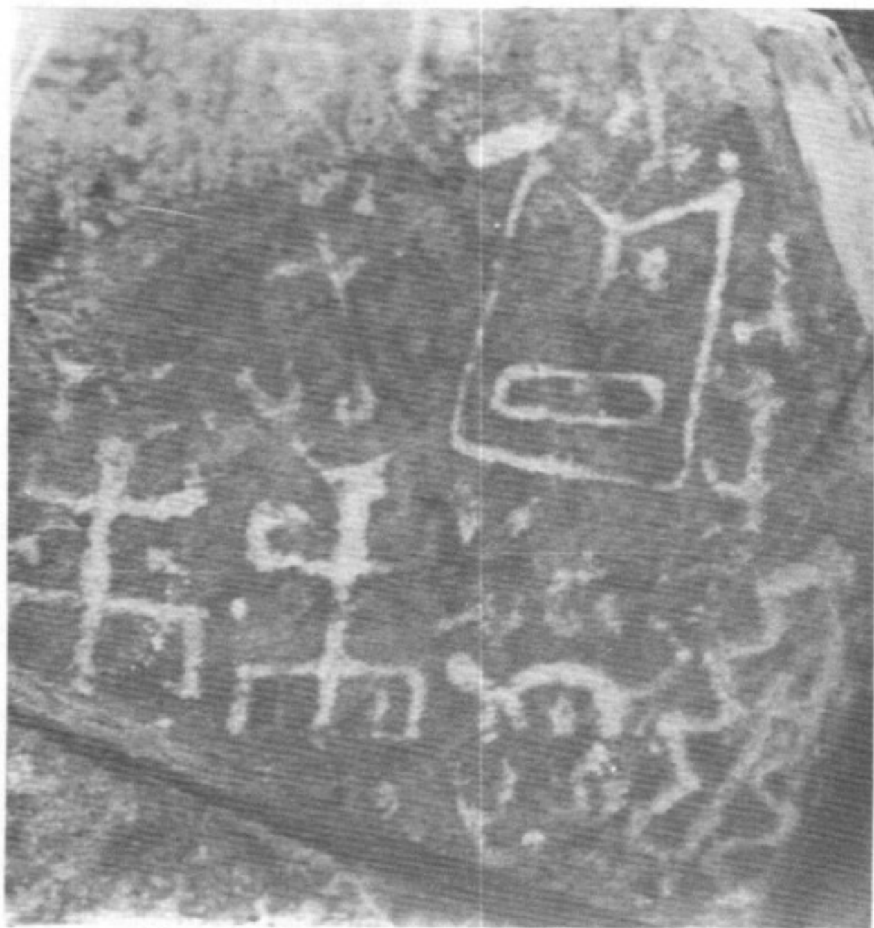
Pictografías. Cueva de Chacunayo. Rinconada. Prov. de Jujuy.

Hacia 1940 las investigaciones se extienden por todo nuestro territorio y aparecen en distintos lugares de nuestro país centros de estudio e investigación que testifican el continuo interés por el noroeste, aunque también se perciben tanteos de investigación en otras áreas como el Litoral y Sierras Centrales.