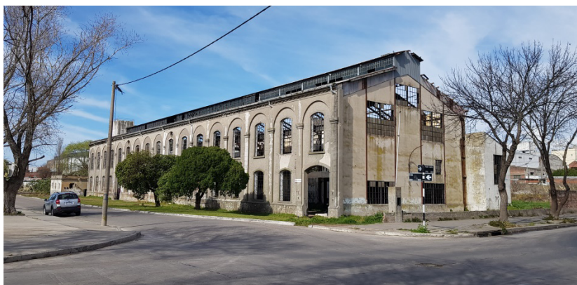
Aspecto actual

La planta tiene una forma de “T” aplanada debido a un cuerpo que sobresale en la parte sur. La nave principal es de 91 por 20 metros, con estructura independiente de hierro que sostiene el puente-grúa, y un techo formado por pórticos con cubierta de chapa canaleta y claraboyas para luz y ventilación en su parte superior. El cerramiento de los entrepaños y los extremos son de ladrillos de máquina con grandes aberturas vidriadas. Su aspecto es sobrio, destacándose su carácter industrial. De proporciones armoniosas, en las fachadas se destaca un ritmo de contrafuertes y arcos dando lugar a pares de ventanas superpuestas verticalmente con un zócalo corrido, buñas en los contrafuertes y un remate con una canaleta en todo su largo. El acabado exterior es de símil piedra 13 .