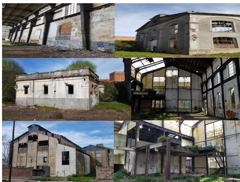
Estado actual

Italiani All Estero, la Delegación Municipal del Puerto, la Universidad Nacional de Mar del Plata (Facultad de Arquitectura y Urbanismo) y las Asociaciones de Fomento del sector, entre otras instituciones.