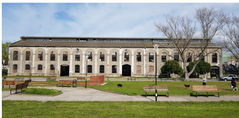
Aspecto actual

En el año 1991, el inmueble fue declarado bien cultural de interés patrimonial y transferido a la municipalidad, a título gratuito, en 1996. Si bien el destino fijado para el edificio era la creación del “Centro Cívico, Administrativo y Cultural del Puerto”, sus instalaciones fueron dadas sucesivamente en uso precario a distintas instituciones, como la Asociación Civil San Jorge, la Compañía Duomo, la Bristol MDQ, la Escuela de Educación Técnica N°1 y la Cooperativa de Transformadores de Mar del Plata. Sin embargo, a pesar de encontrarse en un lugar central en la vida y la historia del barrio puerto (a escasos metros de