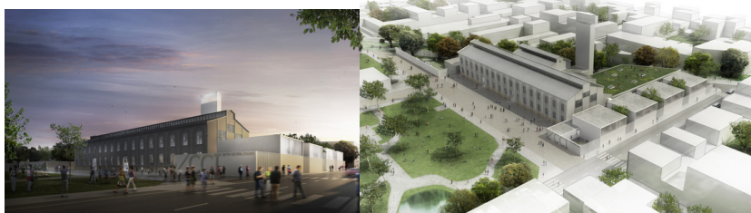
Proyecto Centro Cultural Italiano del estudio Mario Corea Arq.