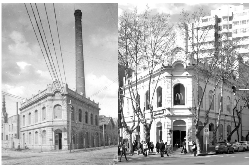
Oficinas comerciales de la Usina Pueyrredón. Circa 1930