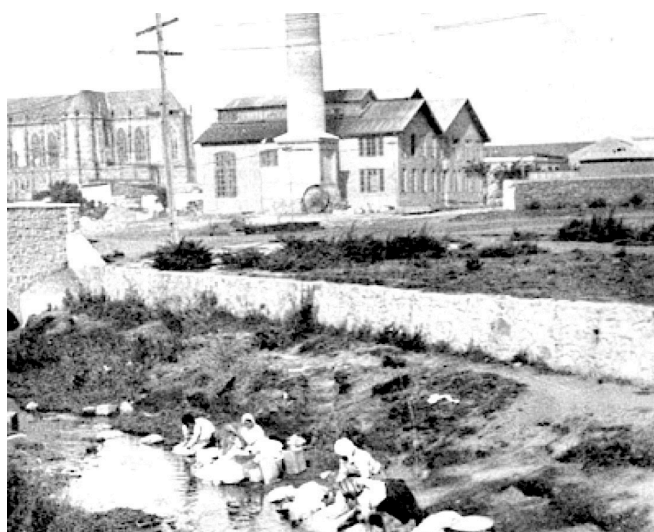
Lavanderas en el Arroyo Las Chacras, detrás se observa la Usina Pueyrredón y la Iglesia Catedral circa 1900

1939. Ese año entró en funcionamiento la de la Cooperativa Eléctrica de Mar del Plata, que abasteció originariamente a cuarenta manzanas comprendidas entre las calles Luro, Colón, Independencia y Guido 9 . Si bien con los años extendió su radio de acción, siempre fue minoritaria la cantidad de usuarios que abasteció dentro de la ciudad 10 .