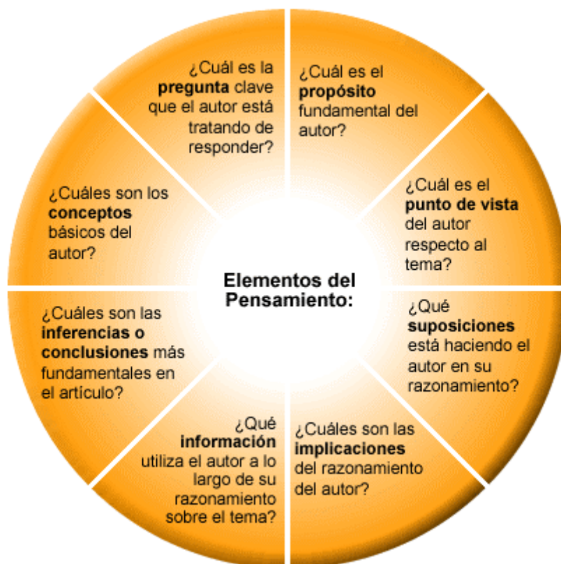
Gráfico No. 2 Elementos del pensamiento crítico manifiestos en la lectura. Fuente: Cómo leer un párrafo (Paul & Elder, 2009)

4. Evaluación, en esta etapa se determinaba la postura final del lector frente al texto, se evaluaba su claridad, precisión, relevancia y profundidad buscando finalmente la creación de un punto de vista que le lleve a comprender al autor y su mensaje.